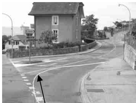
Nouvelle limite du trottoir

Le crédit suivant, de Fr. 18'000.-- a également été approuvé à l'unanimité; il sert à financer l'aménagement du carrefour Combamare - Crêt-de-la-Fin. Ces modifications apporteront une plus grande sécurité aux usagers du passage pour piétons et la visibilité pour les véhicules en provenance de Saint-Aubin sera accrue. Elles consistent en la suppression de l'îlot central ainsi que de ramener les deux voies de circulation du Crêt-de-la-Fin perpendiculaire à la rue de Combamare.